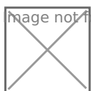
Рисунок 3. Состав денежных средств ТК Панорама